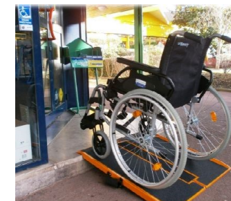
Rampe pour commerce