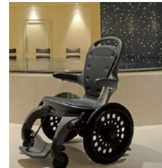
Fauteuil magnétique, Aéroport Thermes, Sauna, Hammam