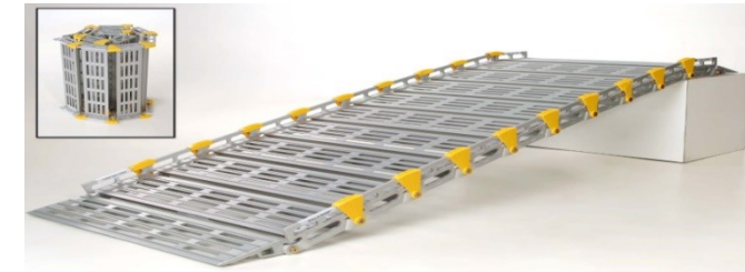
Rampe modulaire et polyvalente