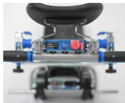
Boîtier de commande du timon