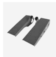
Rampe PTR référence 975 103