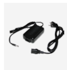
Chargeur PTR référence 075 637