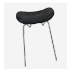
Appui-tête PTR référence 075 104