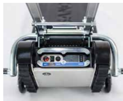
Boîtier de commande de l'unité de base