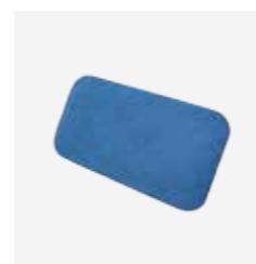
Cousin dorsal PTR référence 975 104