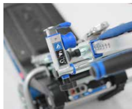
Barre de retenue réglable