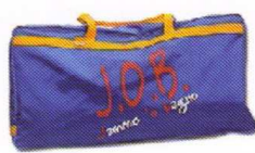
Sac de rangement