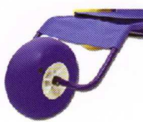
3 eme roue