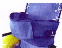
Sangle de maintien