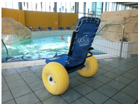
Retrouver les plaisirs de l'eau: Piscine ou plage